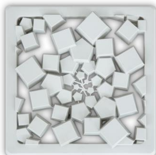
Ivy wall ホワイトグレー